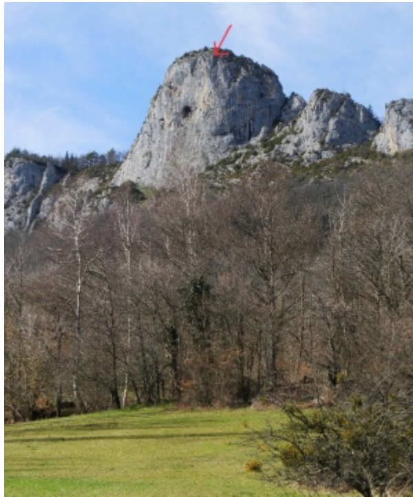
Exit vue du bas