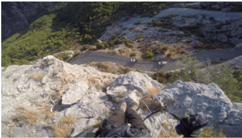
Vue de l'exit