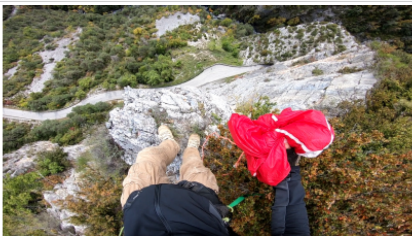
Vue de l'exit