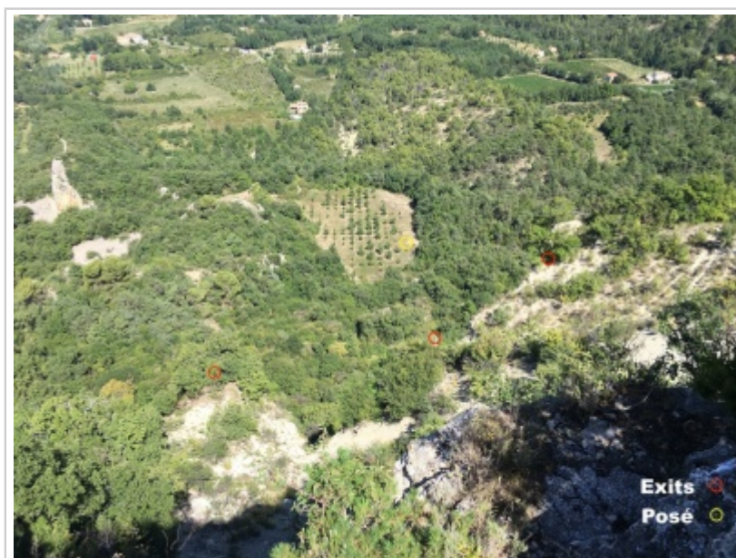
Point de Vue 2

racine du pied d'un arbre, plusieurs exits possible.