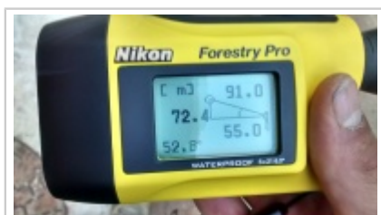
Laser de l'exit depuis le posé