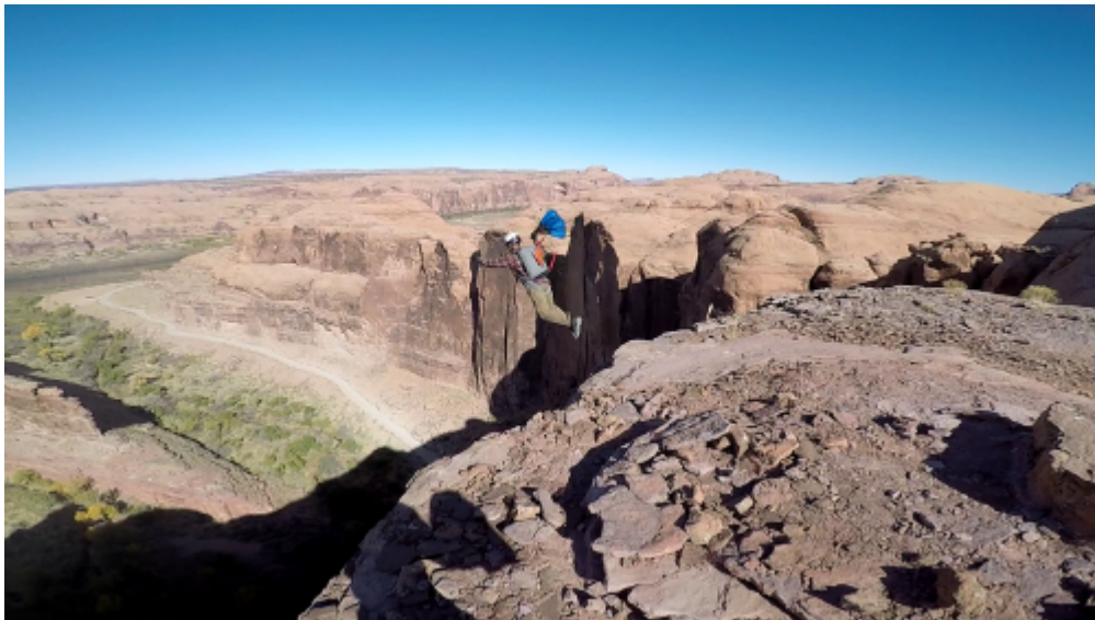
Exit, en arrière plan Tombstone