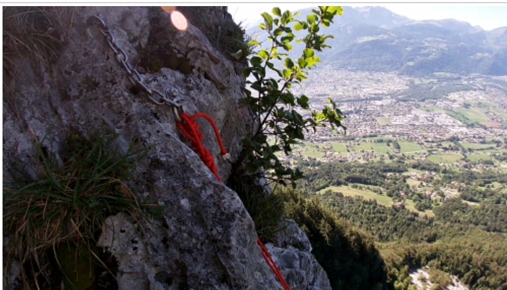
"Relais à l'exit"