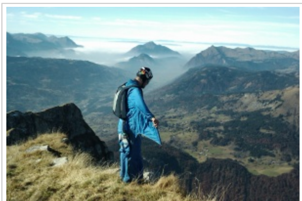
Paddy à l'exit

1500m sont exploitables mais le posé éloigné du pied de forêt oblige à tirer un peu avant la fin de la vallée. Rp F.Gouy